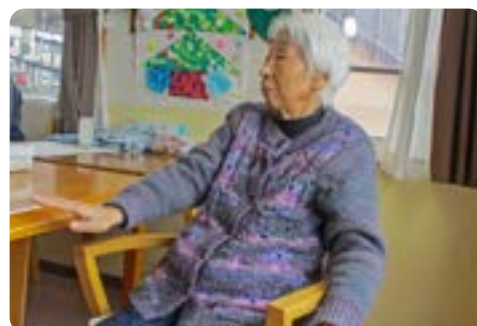
静かに、ゆっくりのFさん