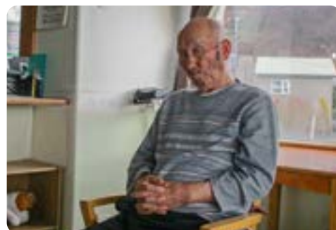
体操終わって「なんか疲れた」とSさん