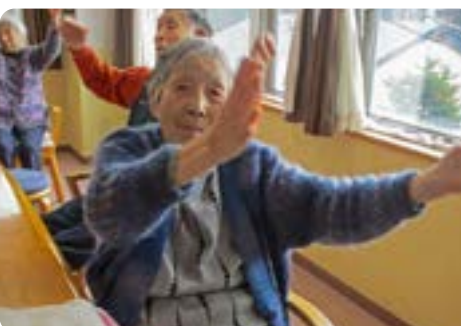
♪あの故郷へ帰ろうかな～ 秋田のふるさとを思いだしてのYさん