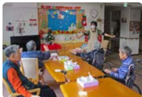
♪ああ～北国の春「両手を挙げて…」の掛け声で