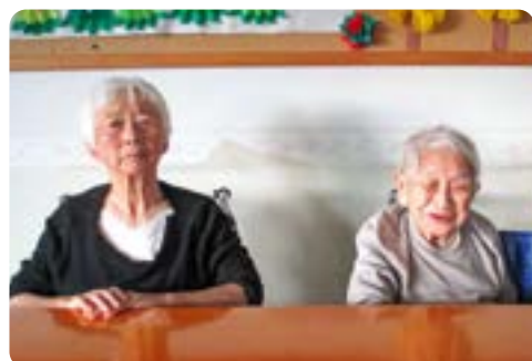
「次、どうだっけ」一呼吸のOさん、Kさん