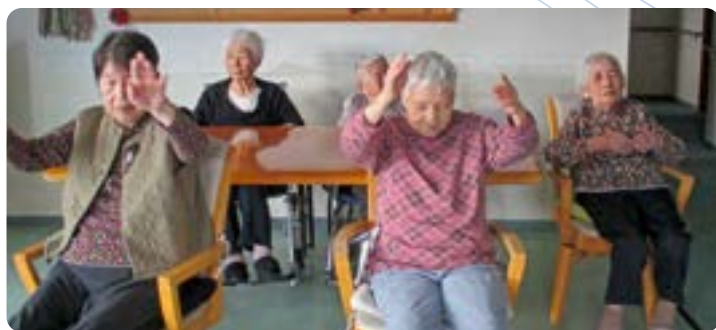
3階ユニット この日何人が微熱をだして居室で休息、それでこの数となりました。残念!