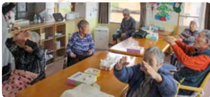
2階ユニットの皆さん、歌に合わせて両手を挙げて

9:30 お茶タイムの前、窓から陽がさしすがすがしい 雰囲気の中「北国の春体操」が始まります。 ♪白樺 青空 南風 こぶし咲く あの丘 北国の春 背筋ピンとし、両腕を伸ばし 体を動かします。